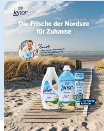
1/1 Anzeige Print Storyline Ad