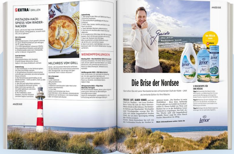
Co-Branded Flexform Advertorial