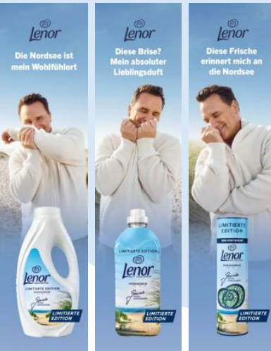
3 x 1/3 Print Storyline Ad