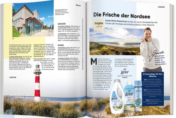
Co-Branded Flexform Advertorial