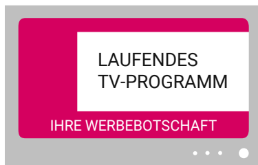
Switch In Zoom