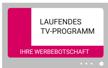
Switch In XXL