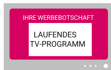
Switch In Masthead