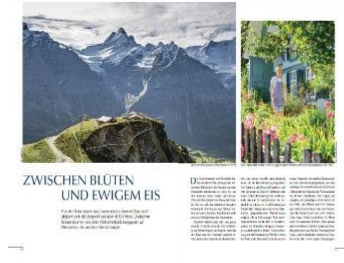
Beispiel: Landreise EXTRA Schweiz