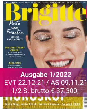
Ausgabe 1/2022 EVT 22.12.21 / AS 09.11.21 1/2 S. brutto € 37.300,-