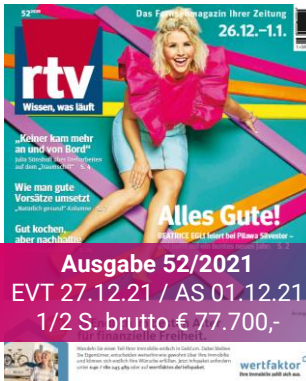
Ausgabe 52/2021 EVT 27.12.21 / AS 01.12.21 1/2 S. brutto € 77.700,-