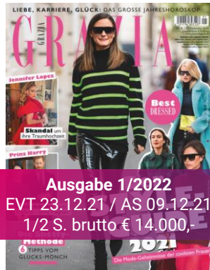
Ausgabe 1/2022 EVT 23.12.21 / AS 09.12.21 1/2 S. brutto € 14.000,-