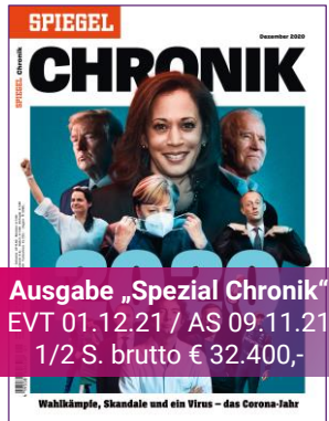
Ausgabe „Spezial Chronik“ EVT 01.12.21 / AS 09.11.21 1/2 S. brutto € 32.400,-