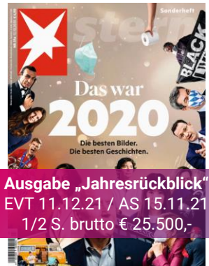
Ausgabe „Jahresrückblick“ EVT 11.12.21 / AS 15.11.21 1/2 S. brutto € 25.500,-