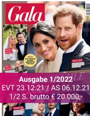
Ausgabe 1/2022 EVT 23.12.21 / AS 06.12.21 1/2 S. brutto € 20.000,-