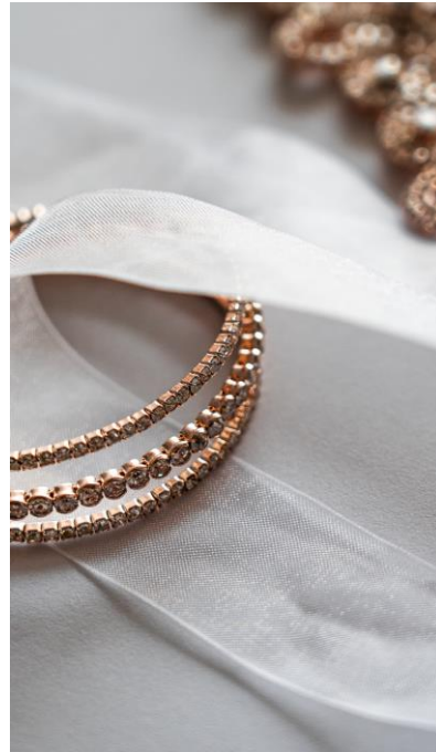
Watches & Jewellery